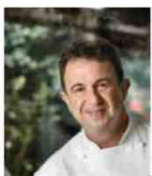
MARTIN BERASATEGUI Rest. MARTIN BERASATEGUI - Espagne