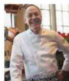
PATRICK O'CONNELL THE INN AT LITTLE WASHINGTON - USA