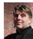
JONNIE BOER DE LIBRIJE Pays Bas