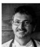
ANDONI LUIS ADURIZ MUGARITZ Espagne