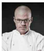
HESTON BLUMENTHAL THE FAT DUCK Royaume-Uni