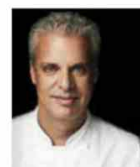
ERIC RIPERT LE BERNARDIN USA