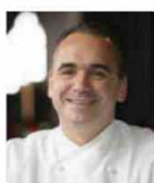
JEAN-GEORGES VONGERICHTEN Rest. JEAN-GEORGES - USA