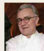
ALAIN DUCASSE Louis XV Monaco