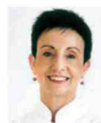
CARME RUSCALLEDA SANT PAU Espagne