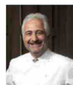
GUY SAVOY Rest. GUY SAVOY France