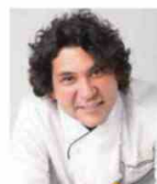
GASTON ACURIO ASTRID Y GASTON Pérou