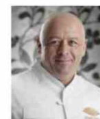
THIERRY MARX SUR MESURE France