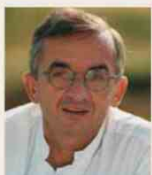
MICHEL BRAS Rest. MICHEL BRAS France