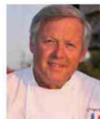
GEORGES BLANC Rest. GEORGES BLANC France