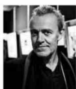
ALAIN PASSARD L'ARPEGE France