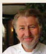
PIERRE GAGNAIRE Rest. PIERRE GAGNAIRE France