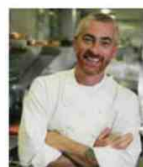
ALEX ATALA D.O.M. Brésil