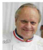
JOEL ROBUCHON L'ATELIER DE JOEL ROBUCHON - France