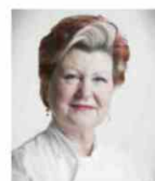
ANNIE FEOLDE ENOTECA PINCHIORRI Italie