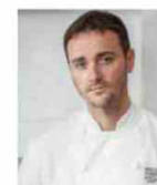
JASON ATHERTON POLLEN STREET SOCIAL Royaume-Uni