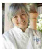
NADIA SANTINI DAL PESCATORE Italie