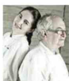
ELENA ET JUAN MARI ARZAK - Rest. ARZAK Espagne