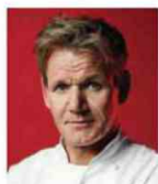
GORDON RAMSAY Rest. GORDON RAMSAY Royaume-Uni