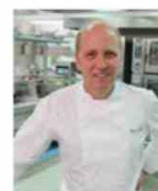
HEINZ BECK LA PERGOLA Italie