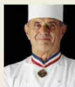
PAUL BOCUSE Rest. PAUL BOCUSE France