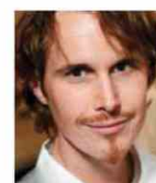
GRANT ACHATZ ALINEA USA