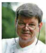
HARALD WOHLFAHRT SCHWARZWALDSTUBE Allemagne