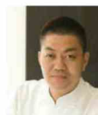
YOSHIHIRO NARISAWA NARISAWA Japon