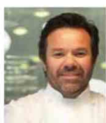
MICHEL TROISGROS Rest. TROISGROS France