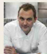
DANIEL HUMM ELEVEN MADISON PARK USA