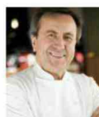
DANIEL BOULUD Rest. DANIEL BOULUD USA