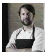
RENE REDZEPI NOMA Danemark