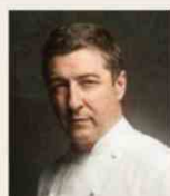
JOAN ROCA EL CELLER DE CAN ROCA Espagne