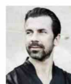
ANDREAS CAMINADA SCHAUENSTEIN SCHLOSS Suisse