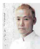
KEI KOBAYASHI Rest. KEI France