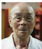
JIRO ONO JIRO HONTEN Japon