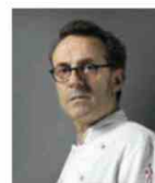
MASSIMO BOTTURA OSTERIA FRANCESCANA Italie