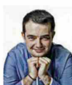
JEAN-FRANCOIS PIEGE Rest. J.-F. PIEGE France